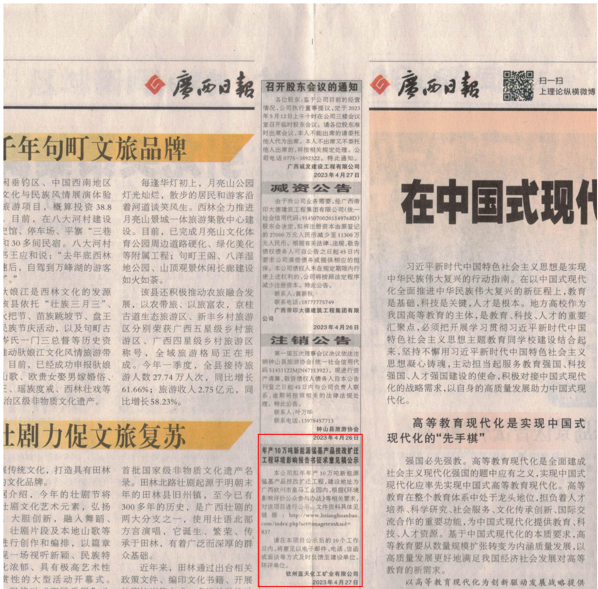
图3-2 本项目征求意见稿环境影响评价信息登报（第一次）公示照片

载体选取符合性分析：本项目位于钦州市钦北区皇马工业园四区，其征求意见稿公示方式采用建设项目所在地且公众易于接触的报纸公开，且在征求意见的10个工作日内刊登征求意见稿公示信息2次，载体选取符合《环境影响评价公众参与办法》要求。