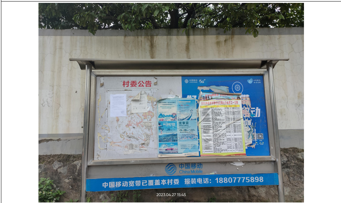
图3-4 征求意见稿现场张贴公示照片