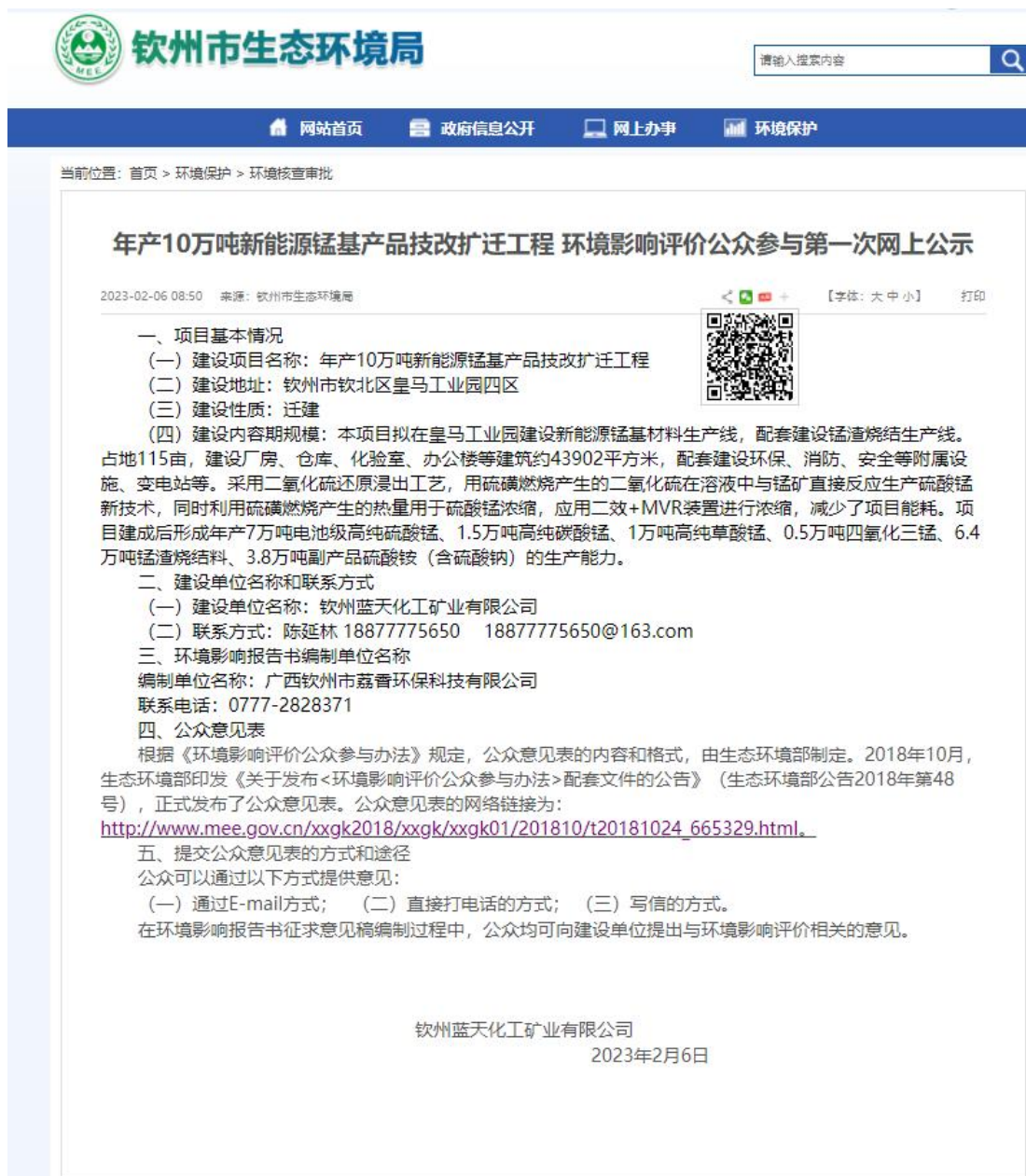
图 2-1 首次环境影响评价信息公开网络公示截图

载体选取符合性分析：本项目位于钦州市钦北区皇马工业园四区，其首次公开环境影响评价信息的网络平台为钦州市生态环境局网站，为本项目所在地相关政府网站，且公众易于接触的。因此本项目首次公开环境影响评价信息的载体选取符合《环境影响评价公众参与办法》要求。公示截图详见图2-1。