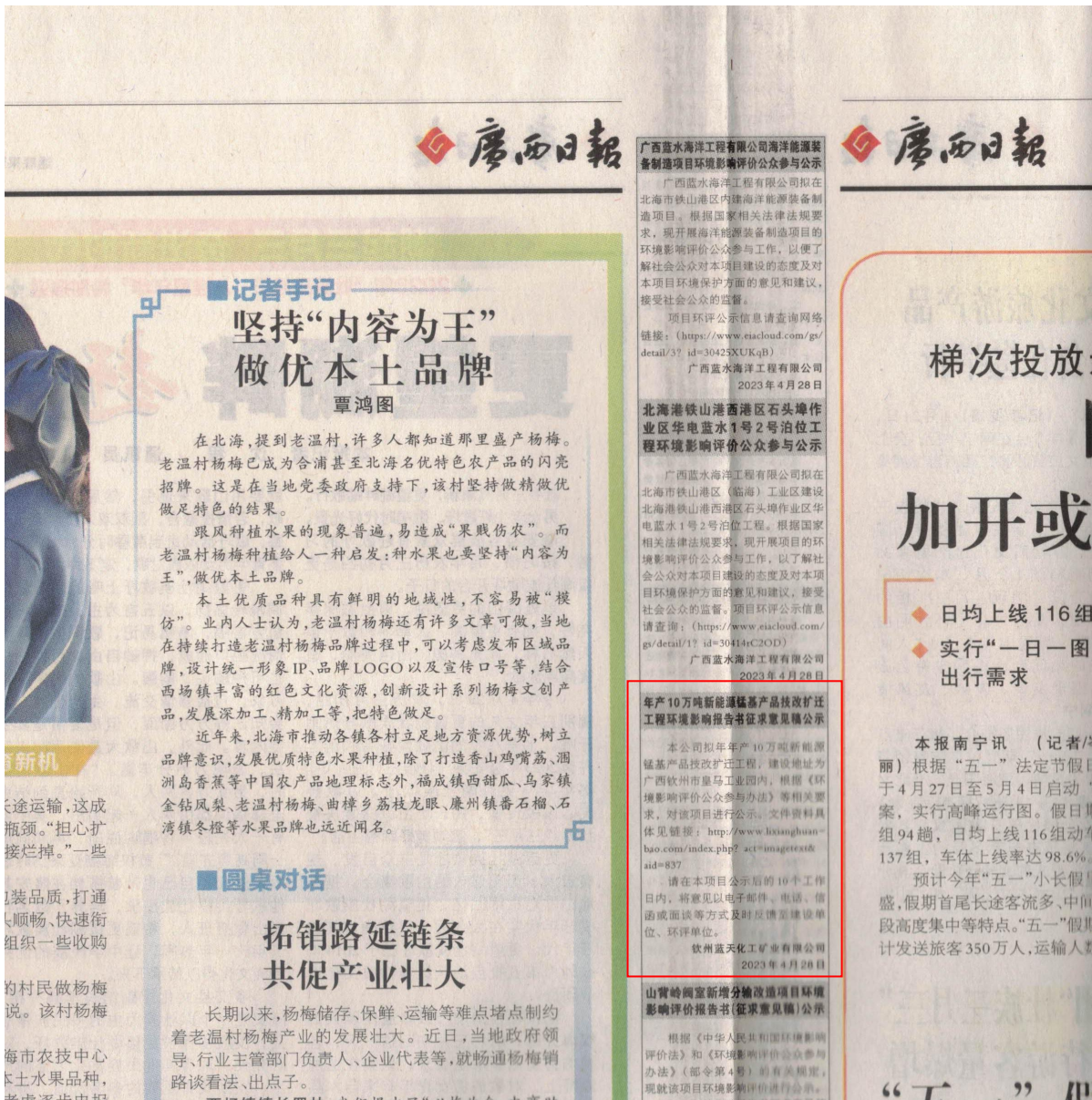
图3-3 本项目征求意见稿环境影响评价信息登报（第二次）公示照片